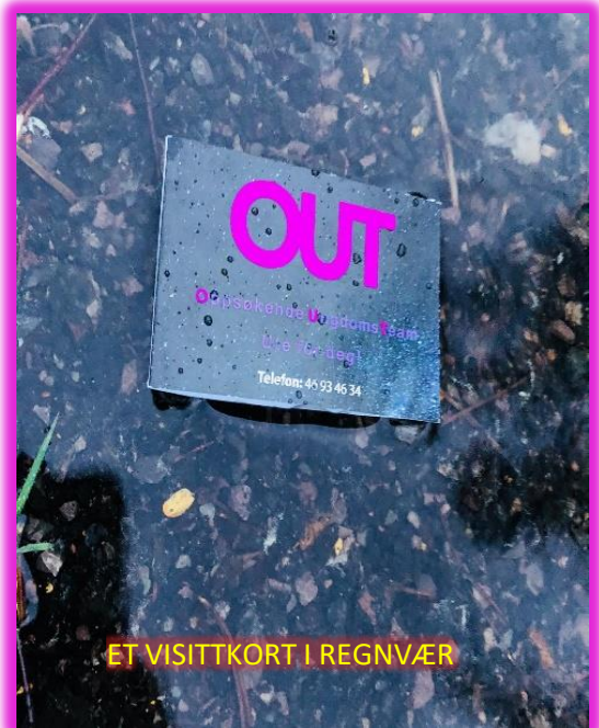
ET VISITTKORT I REGNVÆR