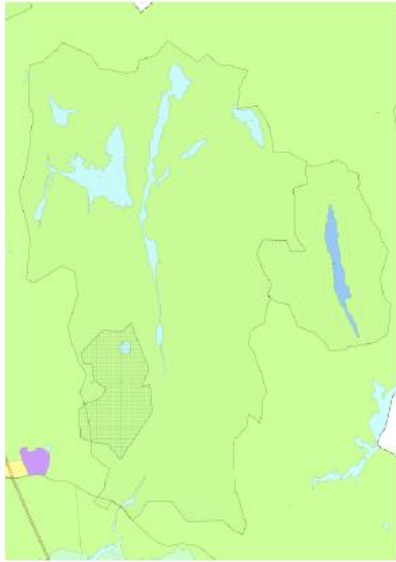
Hensynssone i vedtatt plan