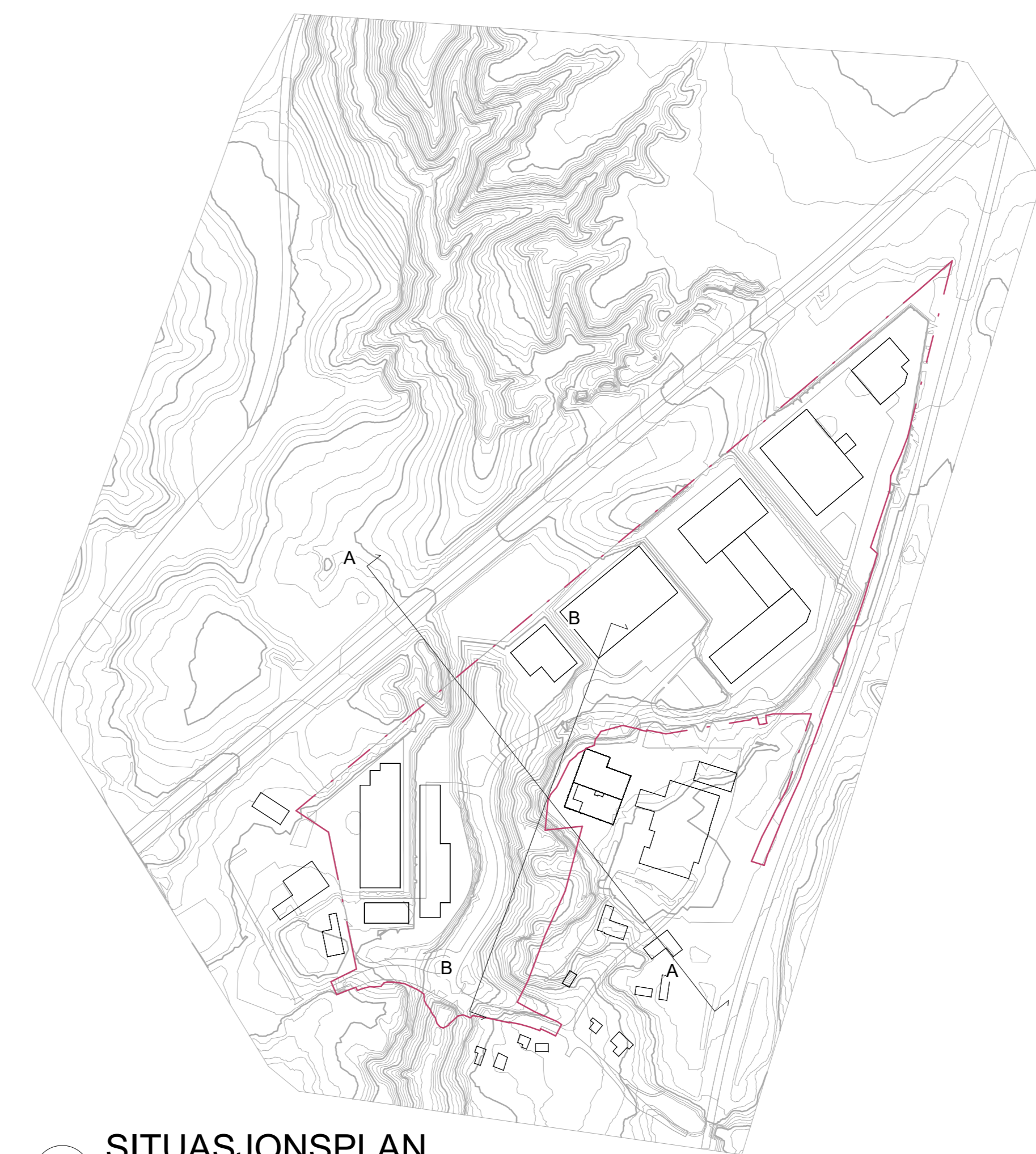
3 SITUASJONSPLAN 1 : 5000