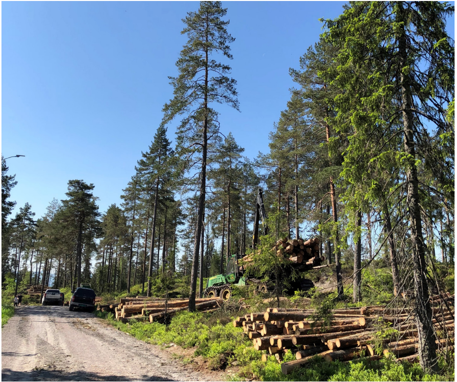
Hogst i Tæruddalen.