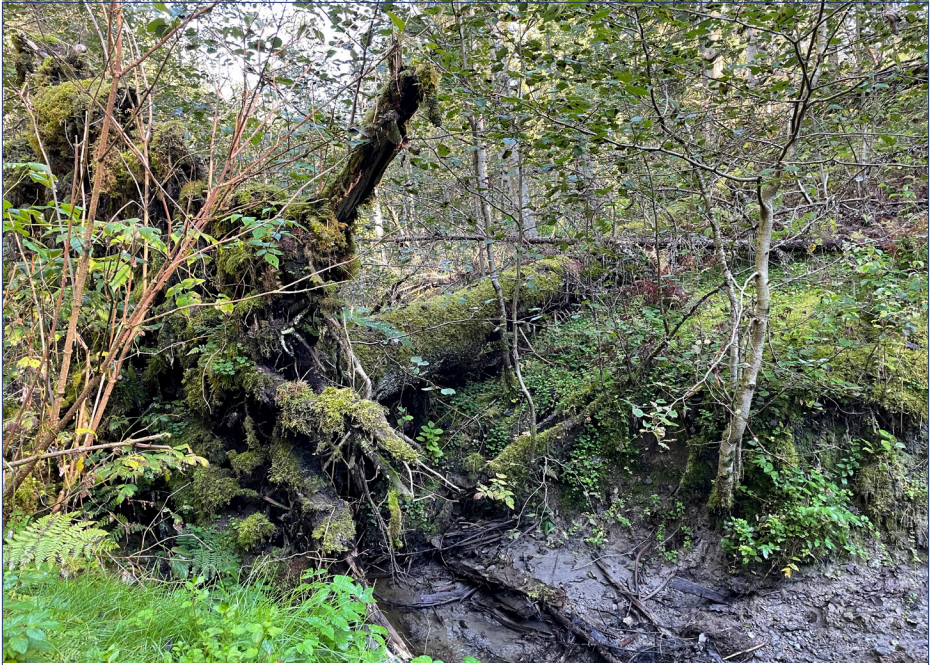
Fra ravinevandring på Frogner.