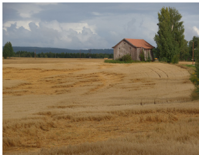
Kornmagasinet til Sørum Sogneselskap.